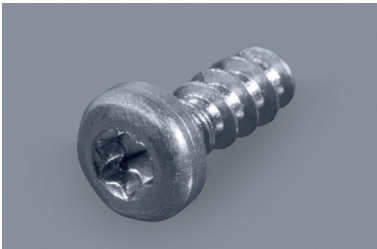
Selbstschneidende / Gewindefurchende Torx-Linsenkopf-Schrauben für Kunststoffe Self-tapping Torx pan head screws for plastics