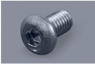
Halbrundkopfschrauben mit Innensechskant Hexagon socket button head screws