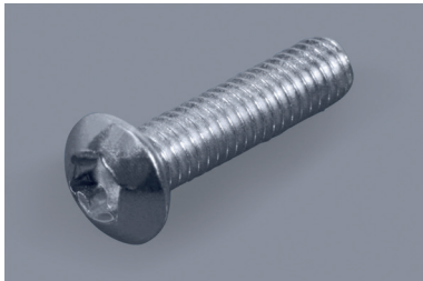
Torx-Halbrundkopfschrauben Torx button head screws