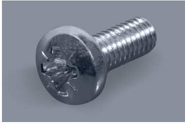
Pozidriv-Kreuzschlitz-Linsenkopfschrauben Pozidriv pan head screws