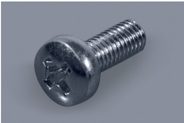
Phillips-Kreuzschlitz-Linsenkopfschrauben Phillips pan head screws