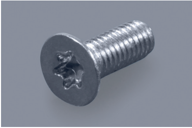
Torx-Senkkopfschrauben Torx countersunk head screws